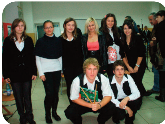
A győztes csapatok!!!

3. Kvízkérdések megválaszolása a megadott anyag alapján. Ez egy picit lehet, hogy döcögős volt, de végtére is sikerült a legjobb tudásunk szerinti válaszokat adni.