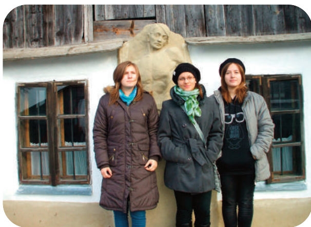
Kirándulás Érmindszenten, Adyfalván